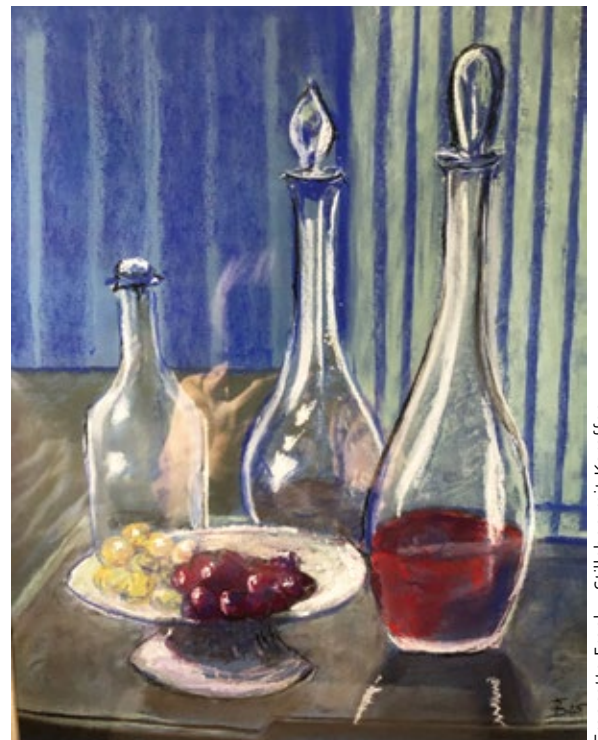
Francette Frank - Stilleben mit Karaffen