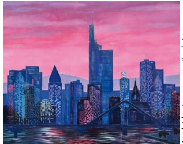
Pascale Ihler - Stadträume im Abendrot