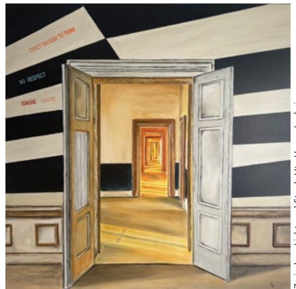
Zwischen Licht und Staub Ute Henze Ludwig