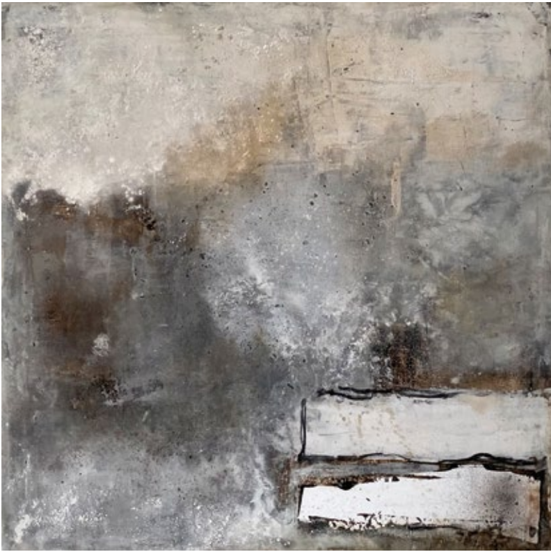
Erosion des Lichts Gudrun Auner