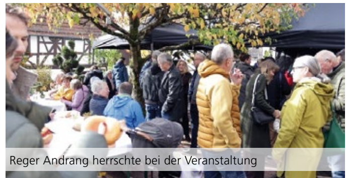
Regier Andrang herrschte bei der Veranstaltung