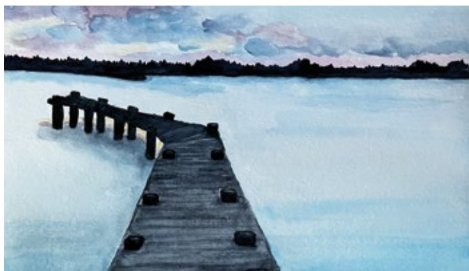
Evelyn Gier - Stille