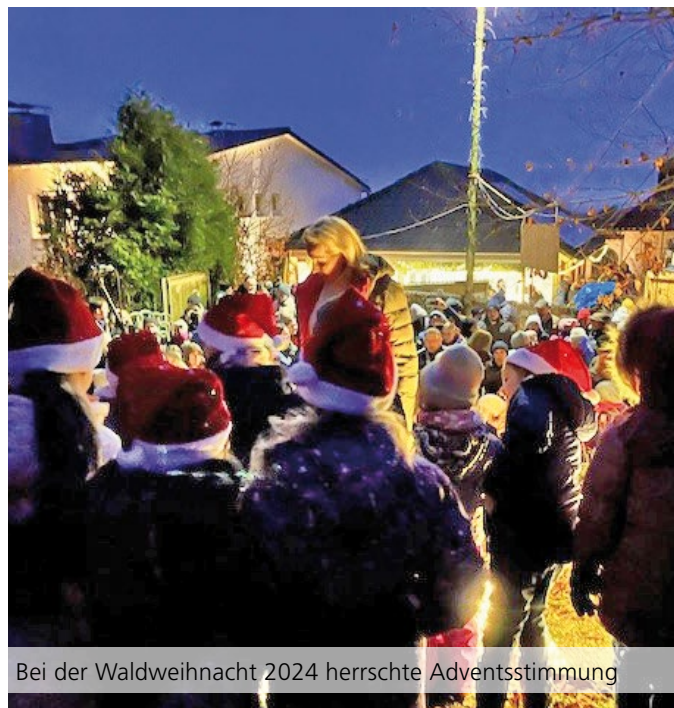
Bei der Waldweihnacht 2024 herrschte Adventsstimmung

Holzbau Reuter · Langgasse 32 · 65529 Waldems-Wüstems · Telefon: 06082 2119 · info@holzbau-reuter.com