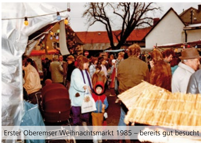
Erster Oberemser Weihnachtsmarkt 1985 – bereits gut besucht