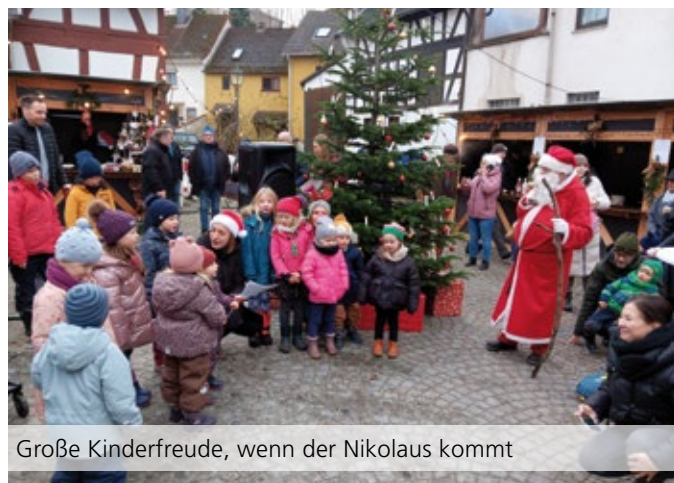
Große Kinderfreude, wenn der Nikolaus kommt