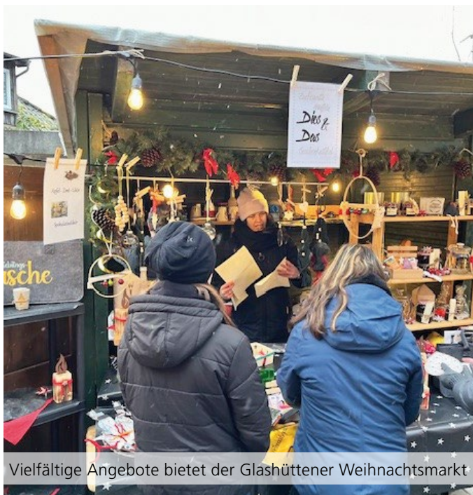
Vielfältige Angebote bietet der Glashüttener Weihnachtsmarkt

Am Sonntag öffnen die Stände von 14:00 bis 20:00 Uhr.