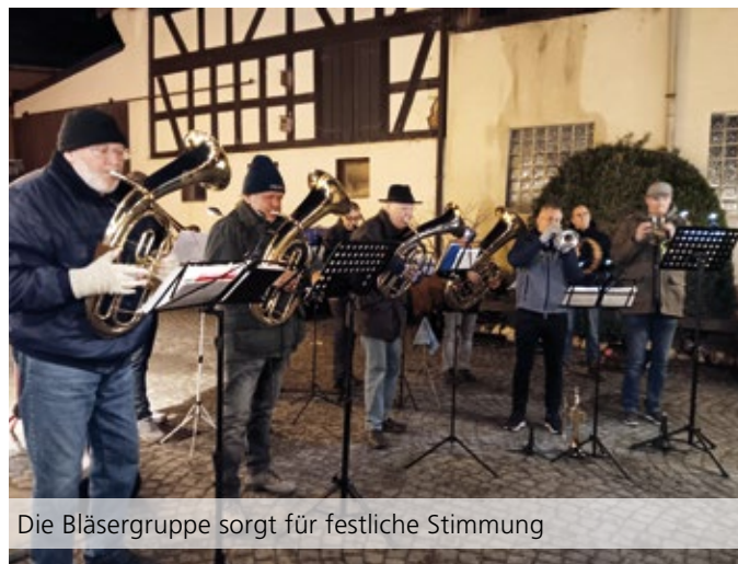
Die Bläsergruppe sorgt für festliche Stimmung

Vertreten sind in diesem Jahr am Sonntag, den 7. Dezember 2025, neben den Sportschützen, die Zackenkicker Oberems, der NABU, der Ev. Kindergarten Oberems, deren Kinder die Gäste mit Gesang erfreuen, und die Bürgerinitiative B.I.O. Geöffnet ist der Markt ab 11.00 Uhr. Um 12.00 Uhr erfolgt die Begrüßung durch Bürgermeister Thomas Ciesielski. Traditioneller Höhepunkt ist die Bläsergruppe, die um 17.00 Uhr festliche Weihnachtsklänge bietet. Parallel läuft der Verkauf frisch geschlagener Nordmantannen aus dem Spessart und eine Tombola. Am Stand des NABU ist Altvertrautes zu besichtigen und zu erwerben: Vogelfutter, kreativ gestaltet, wie z.B. selbst hergestellte Meisenknödelhalter, Futterglocken, Erdnusskränzchen etc. Ferner Nistkästen, Honig, Bienenwachskerzen und selbst Gebasteltes. Ein stilles Gedenken an diesem Tag gilt dem am 27. Oktober 2025 verstorbenen langjährigen Ehrenvorsitzenden und Gründungsmitglied des Schützenvereins Hermann Lichtnecker, der sich über 25 Jahre mit Herz und Verstand für die Belange des Vereins eingesetzt hat.