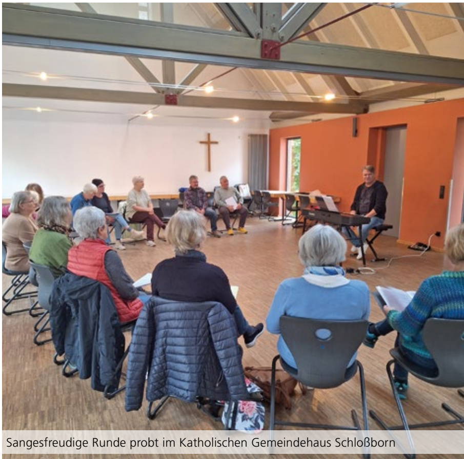
Sangesfreudige Runde probt im Katholischen Gemeindehaus Schloßborn

Schriftliche Kontaktaufnahme besteht zudem unter der Mailadresse popchor-schlossborn@web.de