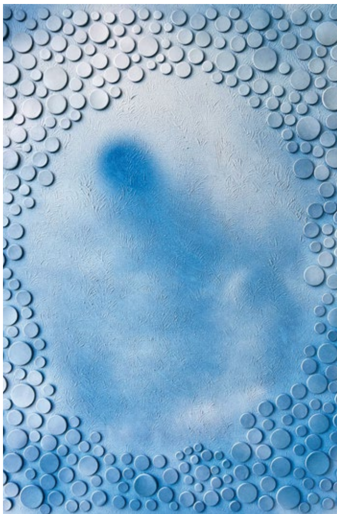
Seunghee Shin - Moleküle der Seele - Nacht

Wie immer zeigen wir hier eine Auswahl der Bilder. Weitere Informationen: kuenstlergruppe-glashuetten.de