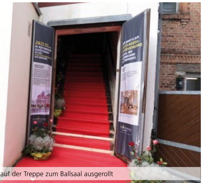
Einen Tag lang wurde für Gäste aus nah und fern der rote Teppich auf der Treppe zum Ballsaal ausgerollt