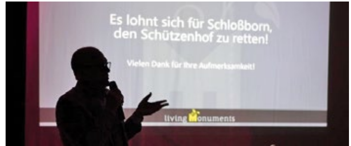
Eine Multimedia-Show zeigte Visionen einer Neubelebung